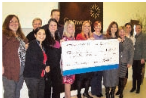
Genworth Canada accepts the Oakville Community